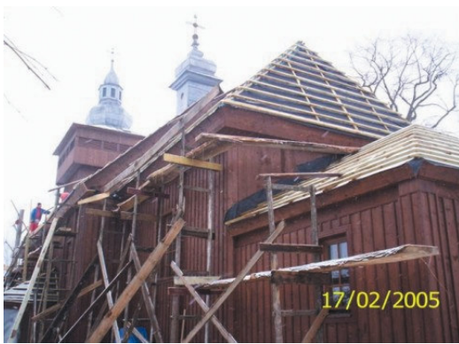
Rys. 9. Kurdwanów