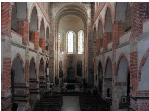
Rys. 3. Tum, Archikolegiata - wewnątrz