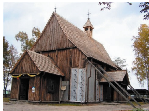
Rys. 12. Boguszyce