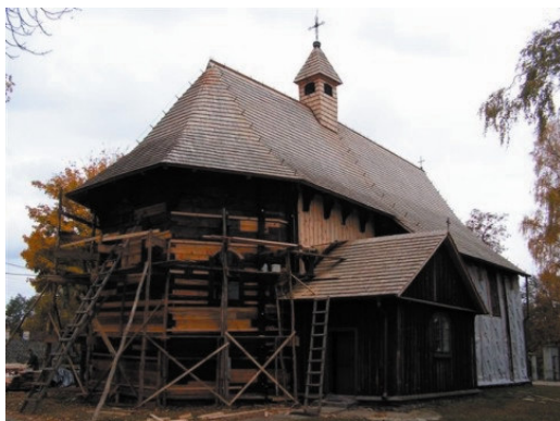
Rys. 11. Boguszyce