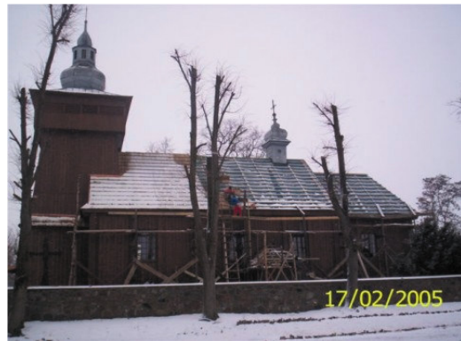
Rys. 8. Kurdwanów