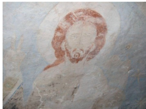
Rys. 4. Tum, Chrystus sędzia XII wieku