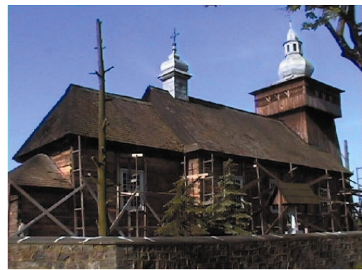
Rys. 10. Kurdwanów. Widok kościoła przed konserwacją