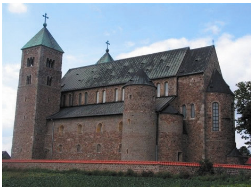
Rys. 1. Archikolegiata, widok na apsydę wschodnią