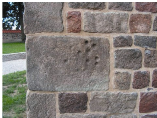
Rys. 2. Tum, wieża południowa, odcisk łapy Boruty