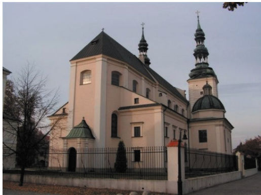
Rys. 7. Łowicz, Bazylika Katedralna