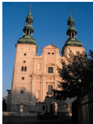
Rys. 6. Łowicz, Bazylika Katedralna