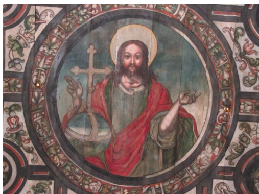
Rys. 13. Boguszyce. Chrystus Pantokrator - polichromia Jana Jantasa na sklepieniu prezbiterium, około 1558 roku